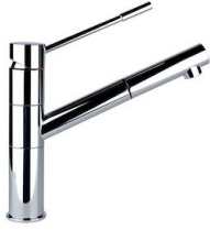
龙头 Lorenzo 8466 000