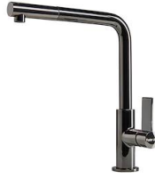
龙头 Omega Plus Gun Metal 8498 856