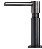
皂液器 Evo Gun Metal 8520 156