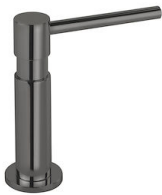
皂液器 Evo Gun Metal 8520 856