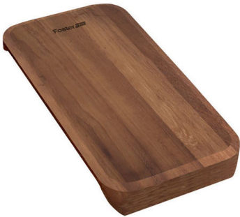
滑动伊罗科木砧板 8643 116