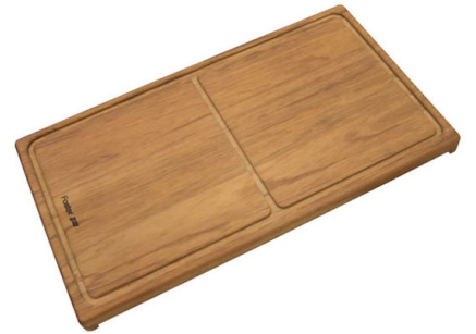
滑动伊罗科木砧板