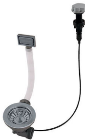
自动下水器 枪黑色