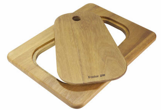
滑动伊罗科木砧板