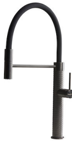
龙头 Skin Gun Metal