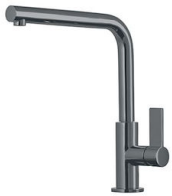
龙头 Omega Gun Metal