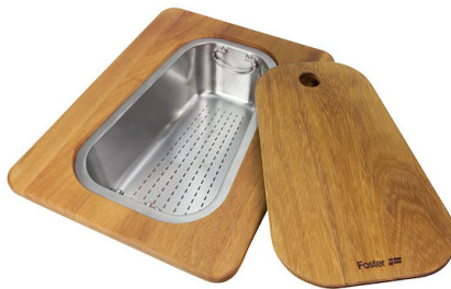
带不锈钢沥水篮的伊罗科木砧板