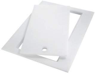
HPDE Twin 砧板