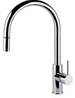
龙头 Camillo 8467 000