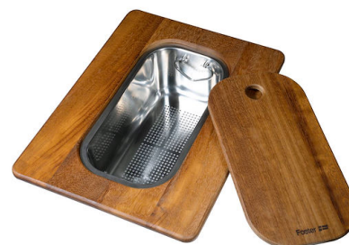
带不锈钢沥水篮的伊罗科木砧板 8644 044