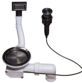
自动下水器 枪黑色 Space - PO 8407 120