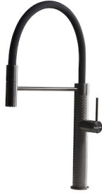
龙头 Skin Gun Metal 8424 856