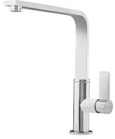
龙头 NYC 8486 000