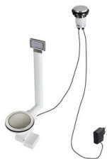
自动下水器 Space - PL 8407 117