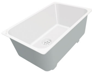
白托盘 8153 100