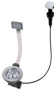
自动下水 - PM 8407 113