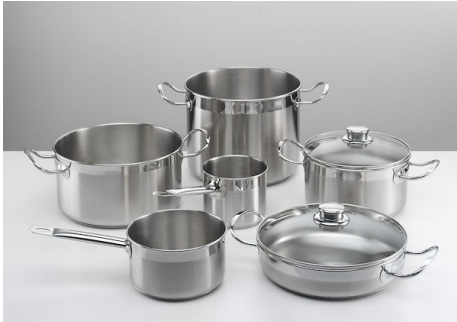
Induction Pro 锅具套装 8件