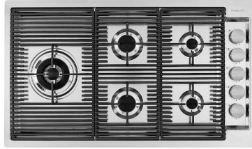
OUTLINE GAS H25 7441 000