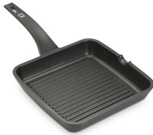
Induction PRO 牛扒烤盘