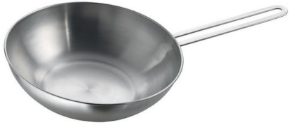
Induction Pro - 平底锅