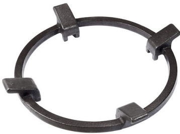
铸铁圆底锅撑 9601 727