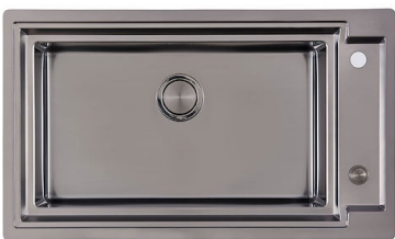
OUTLINE H25 - GUN METAL 6625 006