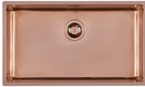
水槽 KE Copper